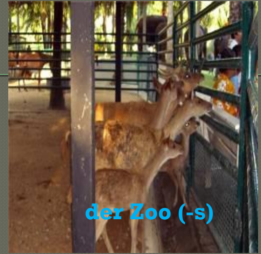
der Zoo (-s)