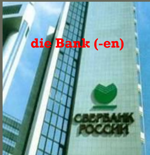
die Bank (-en)