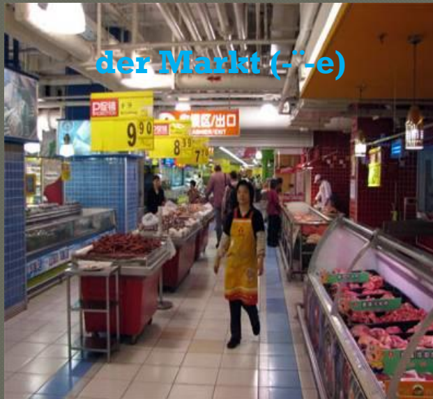
der Markt (-e)