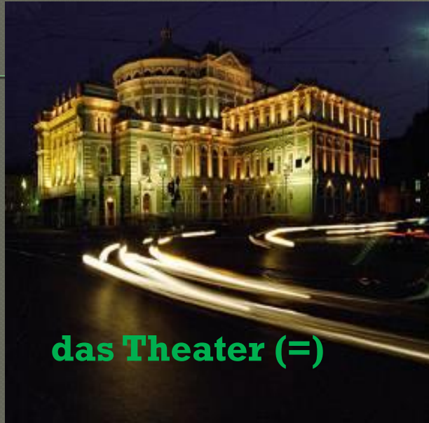
das Theater (=)