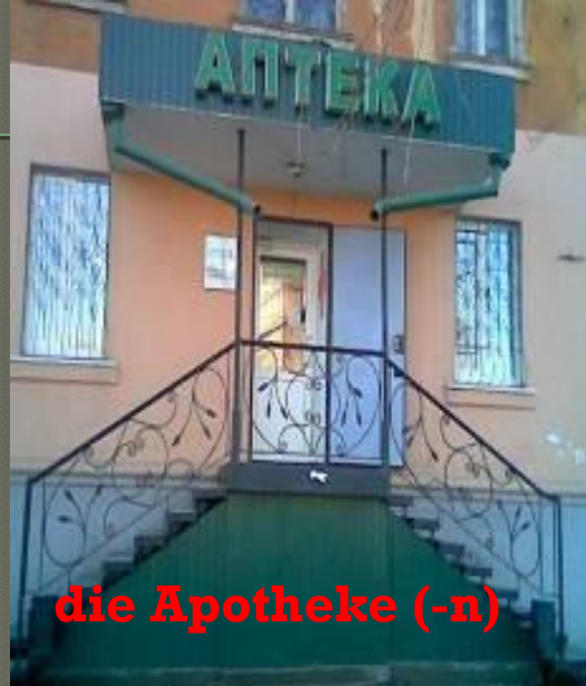
die Apotheke (-n)