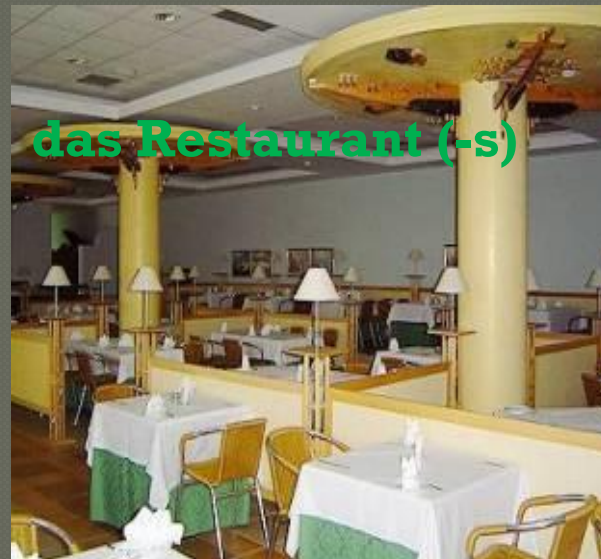
das Restaurant (-s)