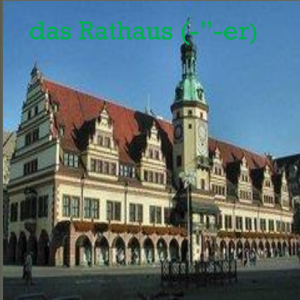
das Rathaus (-er)