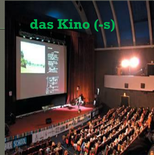
das Kino (-s)