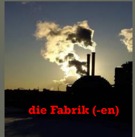
die Fabrik (-en)