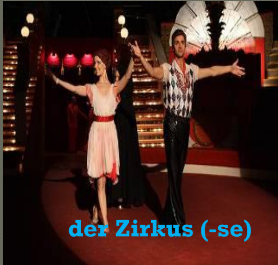
der Zirkus (-se)