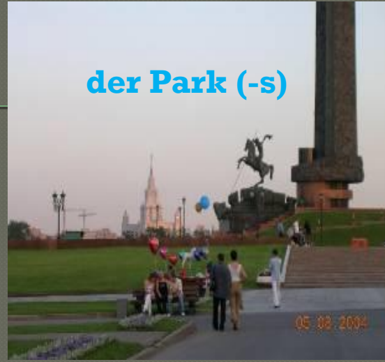
der Park (-s)