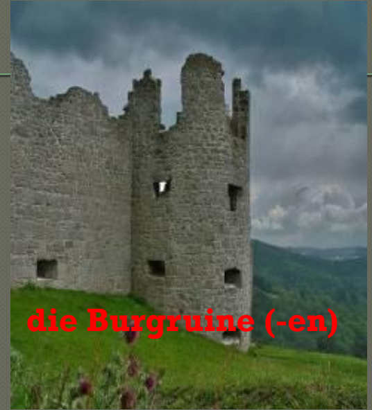
die Burgruine (-en)