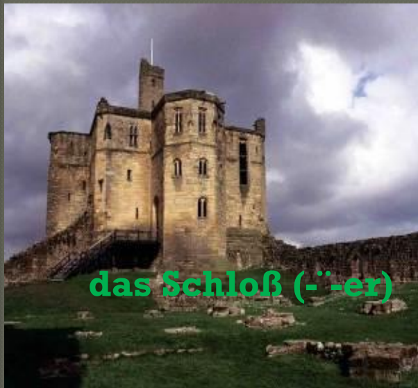
das Schloß (-er)