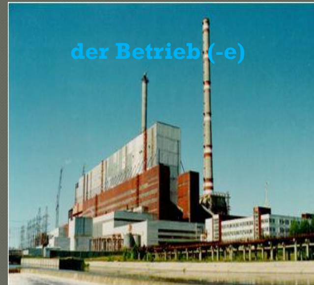
der Betrieb (-e)